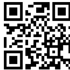
รายงานผลการดำเนินงาน

รวบรวมข้อมูลโดย: กองอนามัยฉุกเฉิน กรมอนามัย ตุลาคม ๒๕๖๗