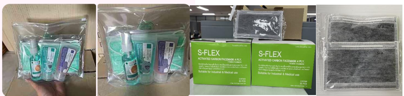
รวบรวมข้อมูลโดย: กองอนามัยฉุกเฉิน กรมอนามัย มกราคม ๒๕๖๘

กองอนามัยฉุกเฉิน กรมอนามัย มีการประสานงาน จัดหาวัสดุ อุปกรณ์การจัดการสุขาภิบาล สุขอนามัย และอนามัยสิ่งแวดล้อม รองรับภาวะฉุกเฉินทางสาธารณสุข เพื่อสนับสนุนการดำเนินงานให้กับพื้นที่ประสบภัยฝุ่น PM๒.๕ เช่น หน้ากากป้องกันฝุ่นสำหรับผู้ใหญ่ หน้ากากป้องกันฝุ่นสำหรับเด็ก หน้ากาก N๙๕ และ SAN Kits เป็นต้น