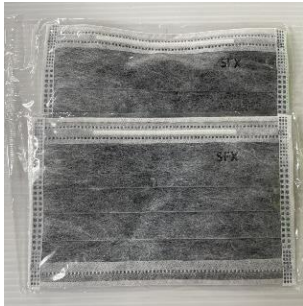
รวบรวมข้อมูลโดย: กองอนามัยฉุกเฉิน กรมอนามัย กุมภาพันธ์ ๒๕๖๘