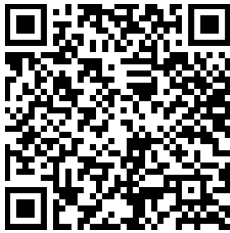
การขับเคลื่อนงานตามตัวชี้วัดฯ